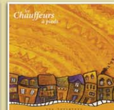
Rue Lavigneur 1999