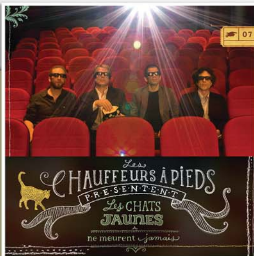
Les chats jaunes ne meurent jamais 2012

Yves Bernard, Le devoir, 11 janvier 2013