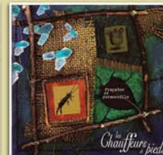
Frapabor et persoreille 2000