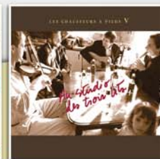
Au studio des trois lits 2006