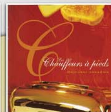
Déjeuner canadien 2004