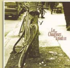
Les Chauffeurs à pieds III 2002